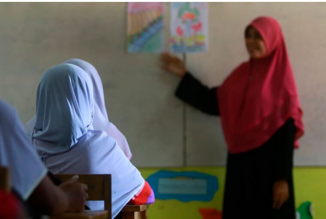
อ่านเพิ่มเติม: ‘ข้ามกำแพงภาษา’ เพื่อพัฒนาผู้เรียน ‘ติดขั้นสูง’ ติดตาม นศ.ครูรัก(ษ์)ถิ่น แต่งเติม ทักษะทวิภาษาสำหรับงานสอน